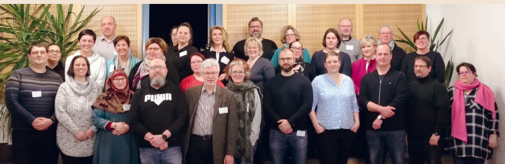
Wahl des Kreiselternbeirats: Alle gewählten 19 Kreiselternbeirats-Mitglieder und deren Ersatzmitglieder

Der erste Kurs war klein, aber herzlich. Bald merkte ich: Senioren brauchen mehr als eine Kursankündigung. Sie brauchen Ansprechpartner, Ermutigung, niederschwellige Zugänge. Also wieder: Webseite bauen, Pressearbeit, Gruppen auf WhatsApp und Signal.