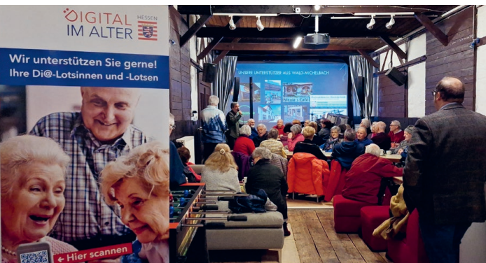
Rege Beteiligung beim smart6Oplus-Schnupperfrühstück.

Was folgte, war ein Neustart auf schwierigem Terrain. Der alte Kreiselternebeirat war praktisch handlungsunfähig, vieles lag brach. Und