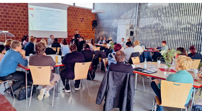
Der "Tag der Schulgemeinschaften" in der Heinrich-Böll-Schule Fürth zum Thema "Neue Schule".