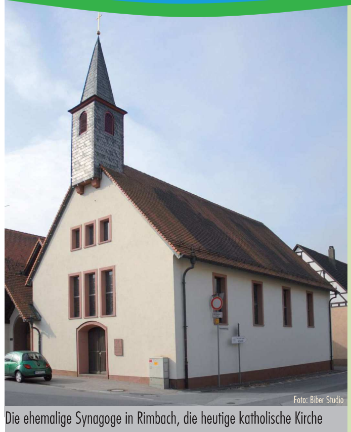
Die ehemalige Synagoge in Rimbach, die heutige katholische Kirche