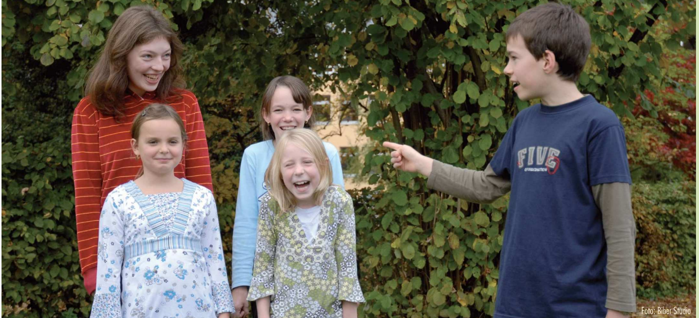
Spaß bei den Proben zur Kinderoper: Darsteller aus dem Brundibár-Ensemble

Die Geschichte hinter der Geschichte: Die Kinderoper wurde nach der Deportation des jüdischen Komponisten Hans Krása in das Konzentrationslager Theresienstadt dort 1943 von internierten Kindern aufgeführt.