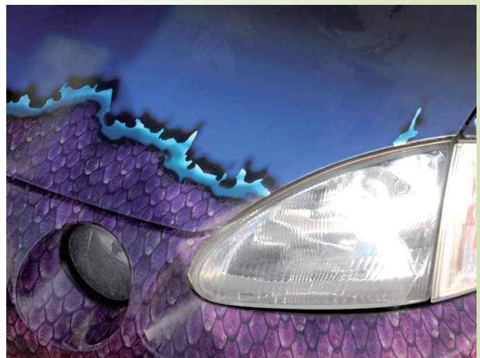
Detail einer Komplettfolierung