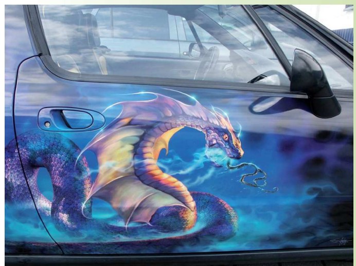
Motiv und Verarbeitung: künstlerisch wertvoll